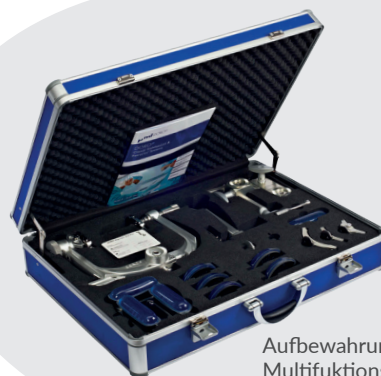
Aufbewahrungsbox für Multifunktions-Schädelklemmensystem Artikel-Nr. 3020-001 (Abbildung mit Multifunktions-Schädelklemme und Zubehör).