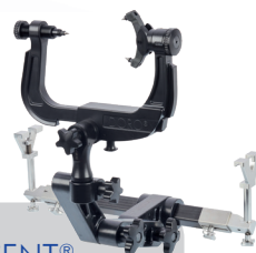
DORO LUCENT® Kopfhaltungssystem Artikel-Nr. 1101.020 (Seite 20)