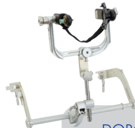
DORO® QR3 XTom Kopfhaltungssystem Artikel-Nr. 4002.100